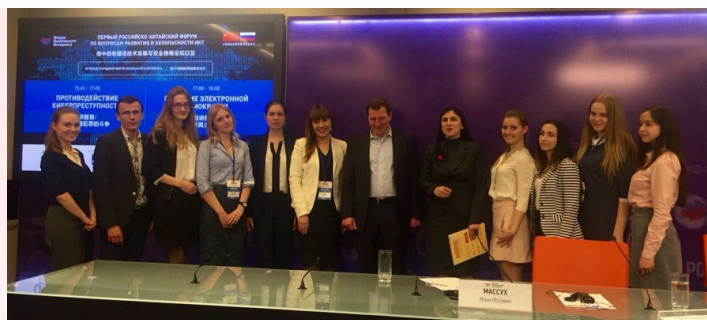
Форум безопасного интернета 27 апреля 2016 г.

Участники секции проследили эволюцию, которую прошла РОИ за три года существования, рассмотрели некоторые статистические данные, а также обсудили проблемы, связанные с популяризацией ресурса, цифровым неравенством граждан, рабочей экспертной группой как субъектом рассмотрения инициативы, и предложили различные способы их решения.