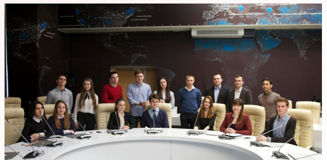
Онлайн-круглый стол с Белорусским государственным университетом. 23 марта 2016 г.

В завершение встречи участники заседания поблагодарили друг друга за конструктивный научный диалог, а также договорились о дальнейшем плодотворном сотрудничестве.