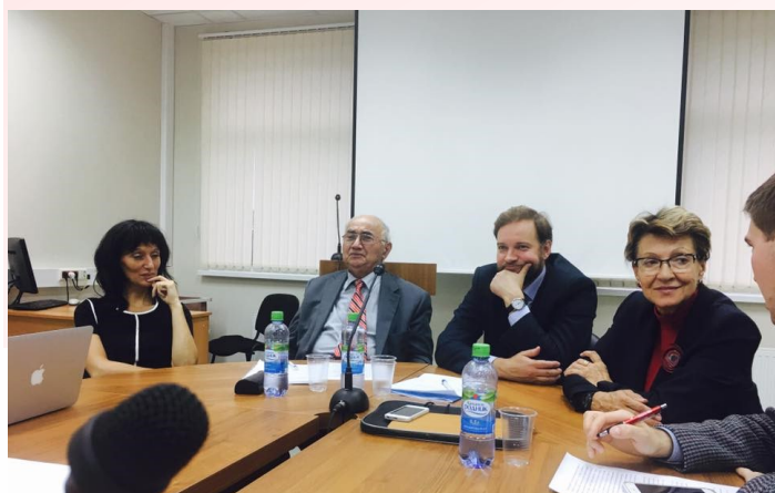
Круглый стол 22 сентября 2016 г.

Живой интерес вызвала проблема дискреционных полномочий органов власти с учетом недавних поправок, внесенных в Кодекс об административных правонарушениях, в контексте спонтанных публичных собраний.