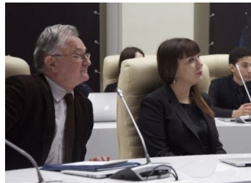
Обсуждение заседания КС РФ 31 марта 2016 г.