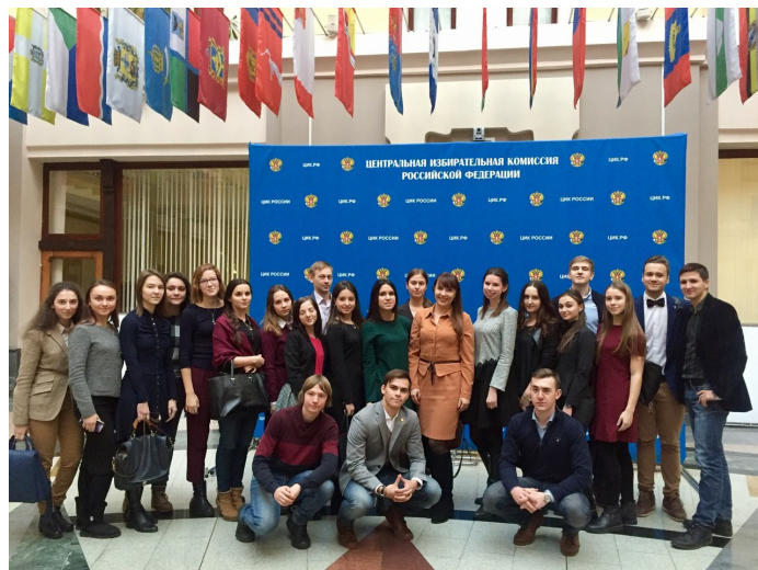
Заседание в ЦИК РФ 13 декабря 2016 г.

Сотрудники ЦИК России рассказали об использовании, эксплуатации и развитии Государственной автоматизированной системы Российской Федерации «Выборы», а также о работе системных администраторов в регионах. Гостям был продемонстрирован фильм о работе ГАС «Выборы», по окончании которого, студенты смогли воспользоваться случаем и собственноручно протестировать работу комплекса обработки избирательных бюллетеней (КОИБ) и комплекса электронного голосования (КЭГ).