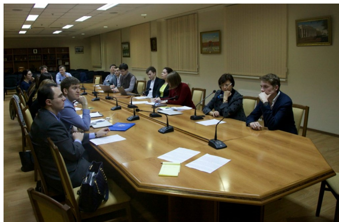
Совместная конференция 15 марта 2016 г.

В завершение участники встречи обсудили судебную защиту прав и свобод личности в обеих правовых системах. Доклады участников круглого стола сопровождалось многочисленными вопросами, перерастающими в полноценную дискуссию, а также предложениями по совершенствованию текущего конституционного законодательства и поисками лучшей модели регулирования того или иного института. Участники круглого стола отметили, что формат встречи—междисциплинарный диалог - позволяет значительно расширить свой кругозор, посмотрев на конкретную проблему через призму истории и права, и договорились о том, что подобные встречи станут традиционными.